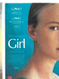
Mar 27 nov à 20h30