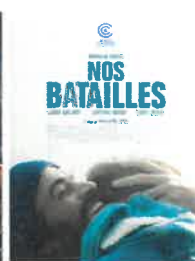
Mar 6 nov 20h30