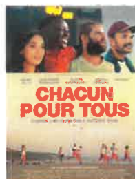
Sam 24 nov à 20h30 Dim 25 nov à 16h