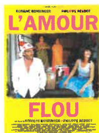
Mar 13 nov 20h30