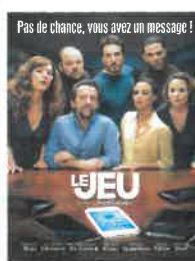
Sam 3 nov 20h30 Dim 4 nov 16h