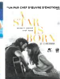
Mar 20 nov 20h30