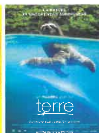
Ven 16 nov 20h30