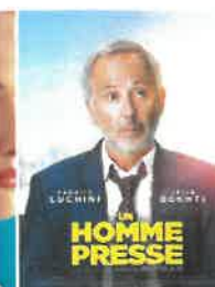
Ven 30 nov 20h30