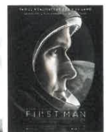
Ven 23 nov 20h30