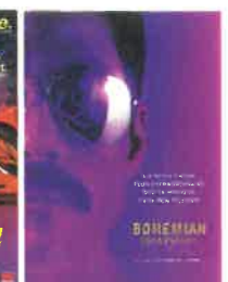
Mar 4 déc à 20h30