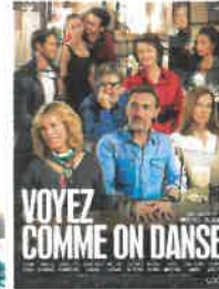
Ven 9 nov 20h30