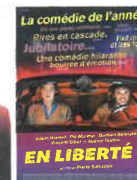
Sam 1 déc 20h30 Dim 2 déc 16h