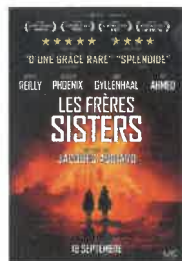
Ven 2 nov 20h30