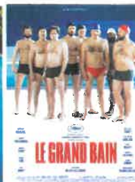
Sam 17 nov à 20h30 Dim 18 nov à 16h