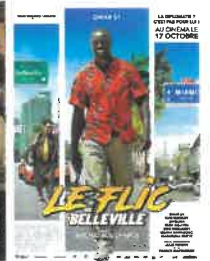
Sam 10 nov à 20h30 Dim 11 nov à 16h